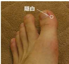
ほぼ爪の生え際です。