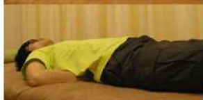
体重のかけ具合で強さを調整

方にもオススメのツボです。手が痛いなあという方は、こぶしの代わりにゴルフボールを2個並べて腎兪を押してみてください。気持ち良いですよ。