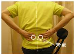
背骨の少し外側にあります