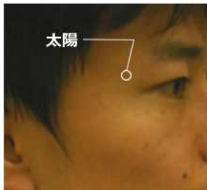
こめかみと目の間が目安です