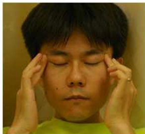
短い時間でも毎日続けましょう